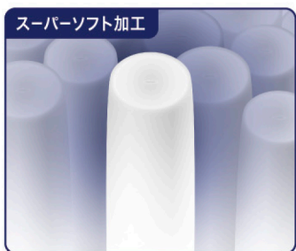
繊維の1本1本がふっくらとリラックス